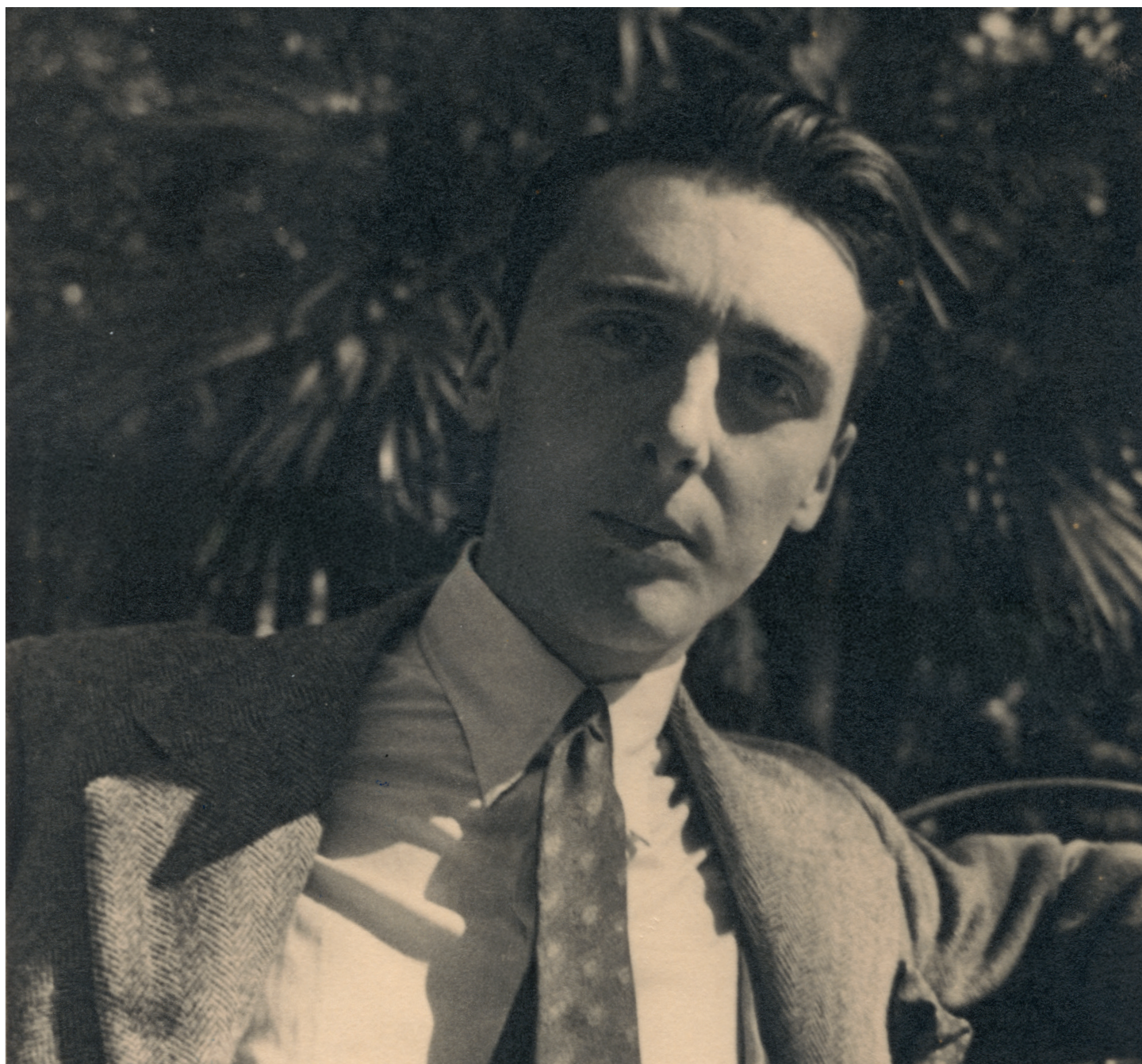
Daniel Cordier, Lyon, 1942.